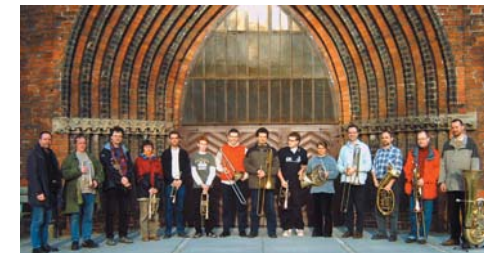
Bläser des Bläserchores vor St. Jacobi