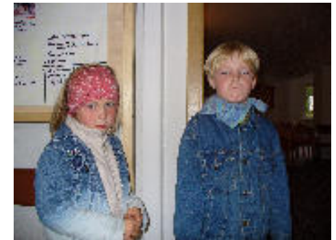
Junge Gäste beim Tag der offenen Tür

insgesamt etwa 60 Besucher. Sogar einige Urlauber haben die Möglichkeit genutzt, sich zu informieren. Auch die Pastoren Dibbern und Kehnscherper waren zeitweise vor Ort und konnten so viele Fragen beantworten. Die einzelnen im Treffpunkt beheimateten Gruppen haben sich auf Informationstafeln