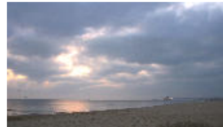
Kantoreiausflug: Sonnenaufgang