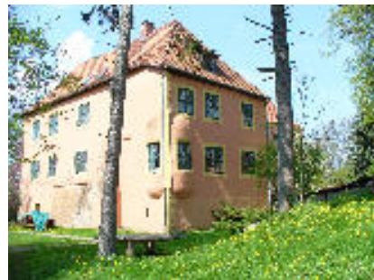
Ausflug zur Wasserburg Turow

Wir, die jungen arbeitslosen Frauen, treffen uns jeden 2. und 4. Don-