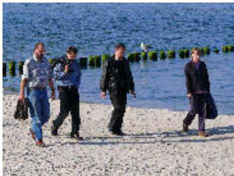
Strandspaziergang in Zinnowitz

Hintergrund des Verbandes sind die voraussehbare Abnahme der Finanzen der Gemeinden z.B. durch sinkende Kirchensteuern und schrumpfende Hilfen aus den westlichen Landeskirchen sowie der Pfarrstellenbesetzungsplan der Landeskirche, der auch eine Reduzierung der Pfarrstelle der Jacobi-gemeinde vorsieht.