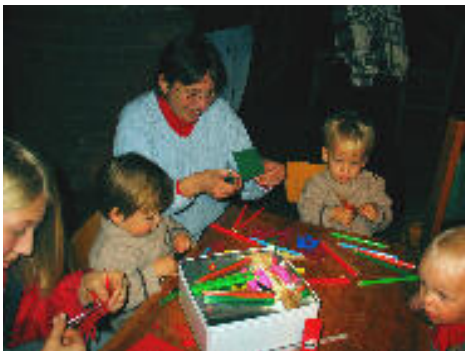
Adventsbasteln in Zinnowitz

Zur Adventsfeier, am 10. Dezember um 15 Uhr, lade ich alle Gemeindeglieder herzlich in unsere (geheizte) Kirche ein. Mit einem Gottesdienst,