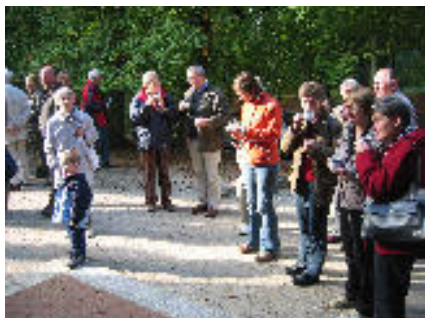
Kantorei beim Kirchbergkaffee

Die Proben für die Bachkantate 106 „Gottes Zeit ist die allerbeste Zeit“ forderten von allen Beteiligten viel Konzentration und Kraft, aber so eine intensive Probenmöglichkeit vor einer Aufführung ist auch eine große Hilfe. Für Ausgleich sorgten die geselligen Abende, wo neue Kontakte geknüpft und alte aufgefrischt werden konnten.