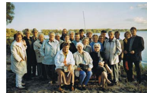
Klosterfahrt nach Verchen und Dargun am 30. September 2005. Vor der Rückfahrt trafen wir uns am Kummerower See in der Abendsonne zum Reisesegen.

zum Mitsingen und Mitspielen: Die sechs Kantaten werden in fünf Gottesdiensten aufgeführt (siehe Gottesdienstplan). Wer mitsingen oder -spielen möchte, wende sich wegen der Probertermine bitte an das Institut für Kirchenmusik, Tel. 86 35 20.